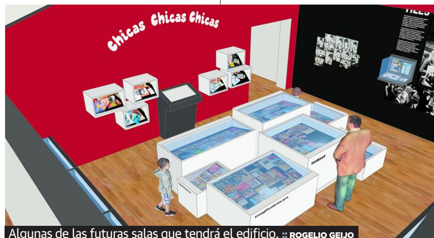
Algunas de las futuras salas que tendrá el edificio.