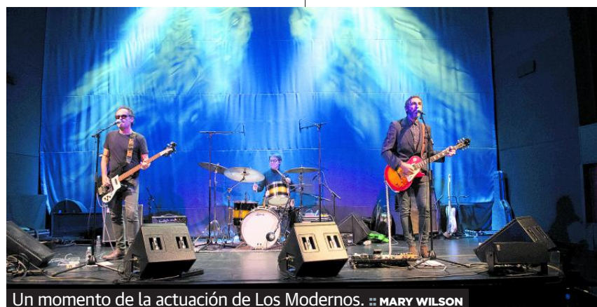
Un momento de la actuación de Los Modernos.

En resumen, una estupenda tarde de música. Dos maneras distintas pero complementarias de captar la esencia del pop de los sesenta y llevarlo a un nuevo espacio a base de mezclar beat con otras esencias para enriquecer la combinación final. Zabriskie y Los Modernos dejaron el listón del pop leonés bien alto en Madrid.