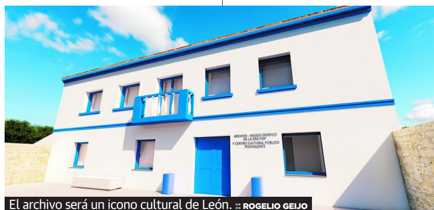
El archivo será un icono cultural de León.