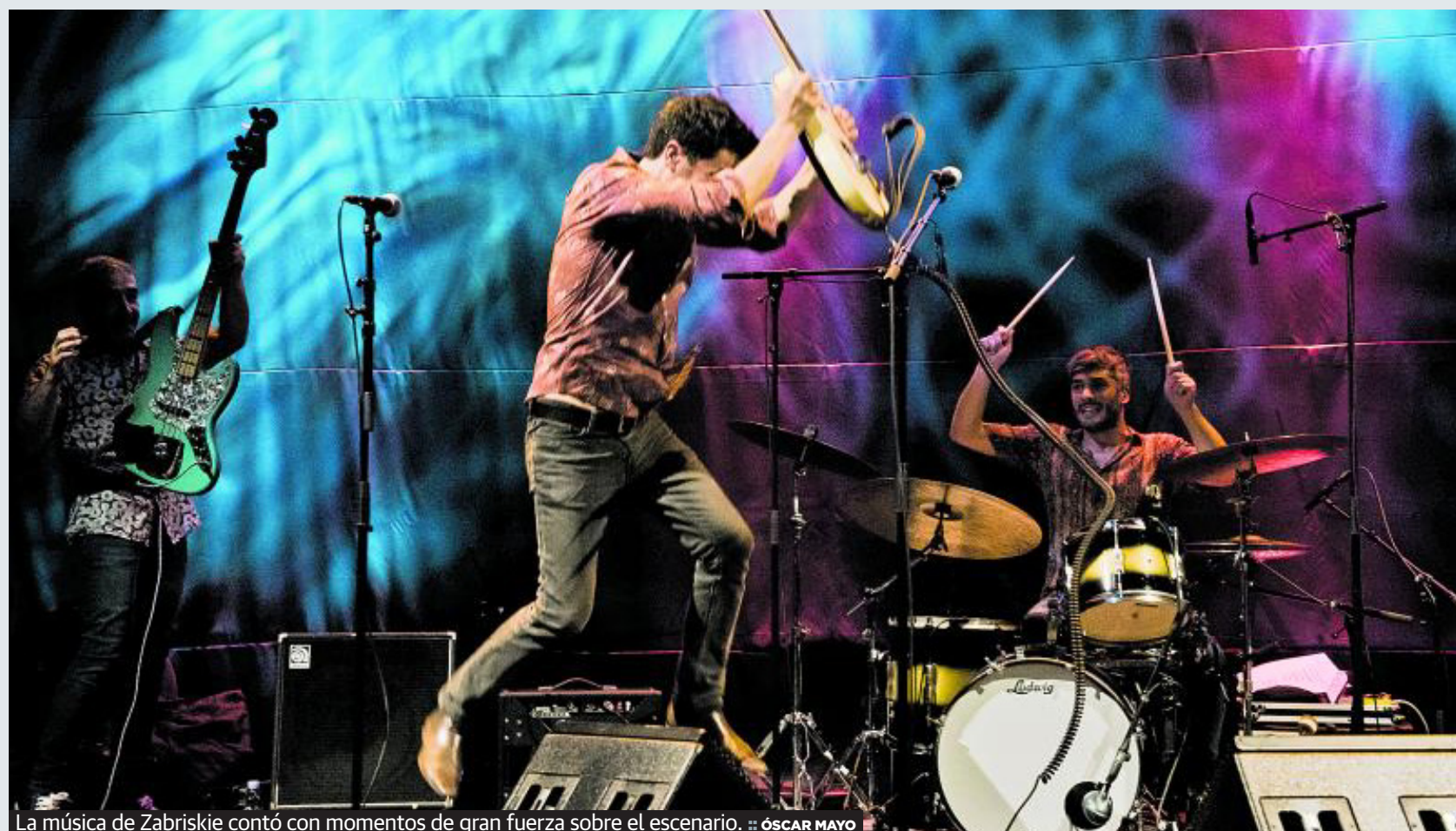
La música de Zabriskie contó con momentos de gran fuerza sobre el escenario.