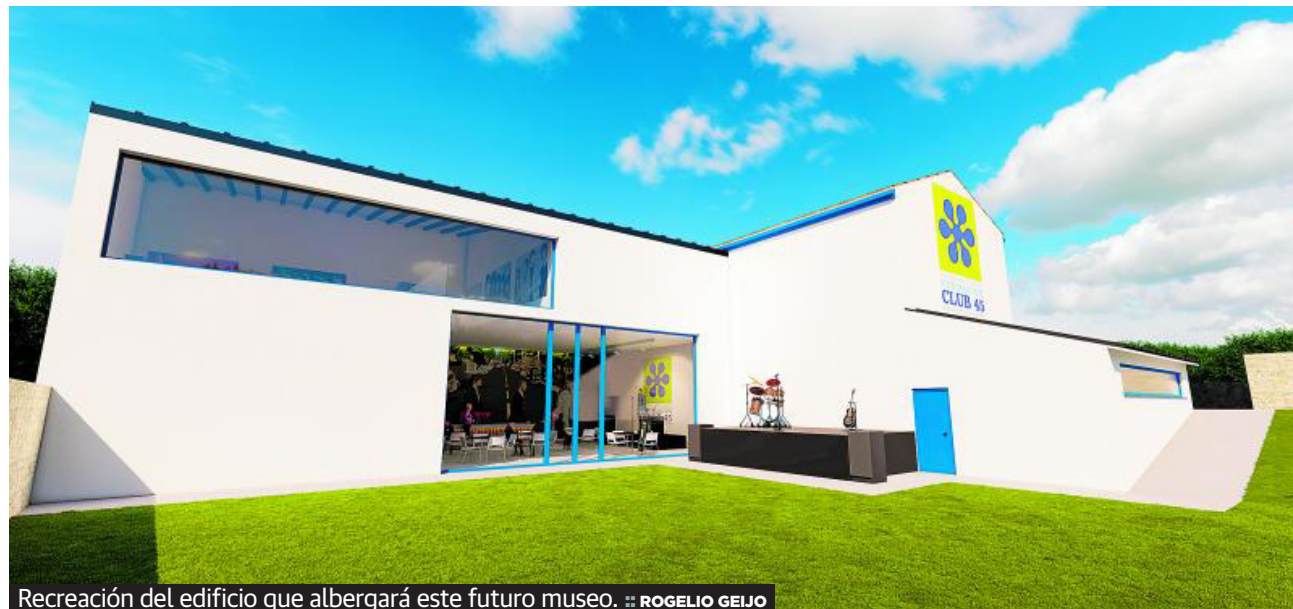
Recreación del edificio que albergará este futuro museo. :: ROGELIO GEIJO

El martes 19, la Sala Berlanga abrió sus puertas y los primeros visitantes pudieron recrearse en las fotografías de 'La Resistencia Sonora', una colección de retra-