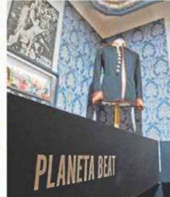
La casaca de la portada de 'Mi universo'.