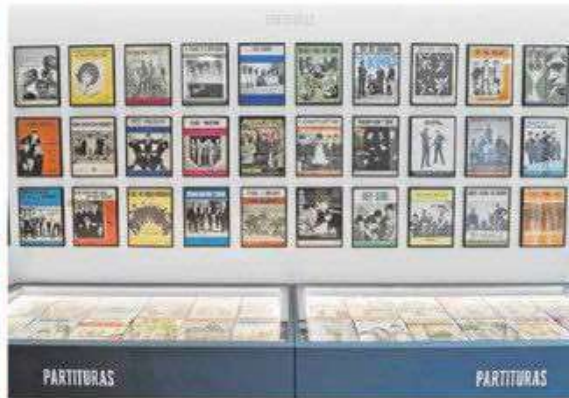
Los fondos de música impresa son particularmente cotizados.