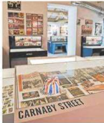
El pop provocó la aparición de prensa especializada.