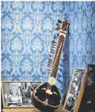
El sitar, todo un icono de la época psicodélica.