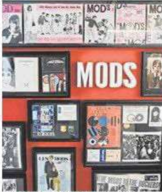
Los 'moderistas' se reivindicaban como 'mods'.