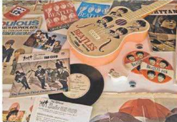
La beatlemania como cuna del merchandising.

Pero precisamente ahí arranca esa doble orientación, al profano y al experto: mientras unos dis-